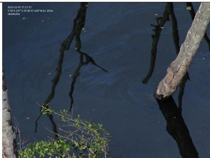
Foto 5- Feição com características de óleo próximo a mina 18